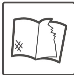
著しい汚れ・破損